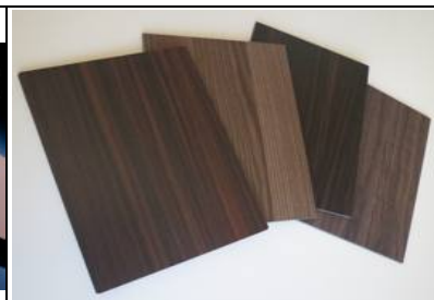
Пластиковые фасады древесные