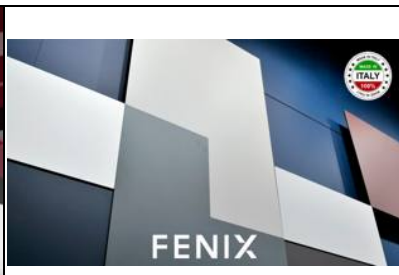
Пластиковые фасады FENIX